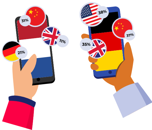
Fig. 2 - Top 3 crossborder shopping landen

Naast een hogere omzet, is het grootste verschil dat in Duitsland niet regelmatig aankopen worden gedaan bij Nederlandse e-commerce shops, maar andersom wel.