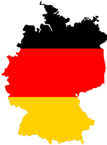
Fig. 3- Duitse gebruiker in beeld