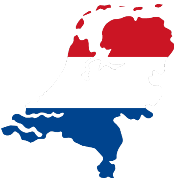
Fig. 4- Nederlandse gebruiker in beeld